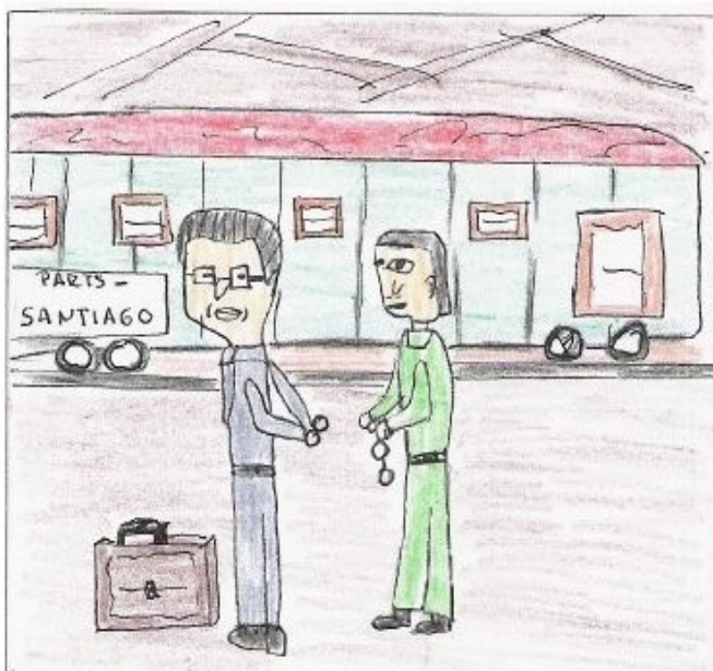
Ao regreso foi detido no 1.946 para ser condenado a tres anos de cárcere.