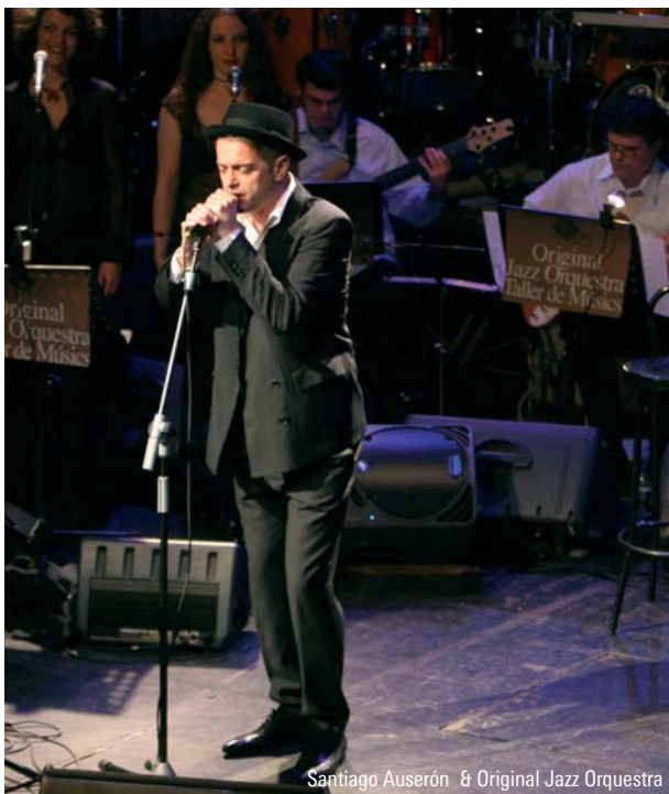
Santiago Auserón & Original Jazz Orchestra

Santiago Auserón refai os temas da súa época en Radio Futura e Juan Perro para darlles un aire novo xunto aos magníficos músicos da Original Jazz Orchestra do Taller de Músics. (En colaboración coa Fundación Caixa Galicia).