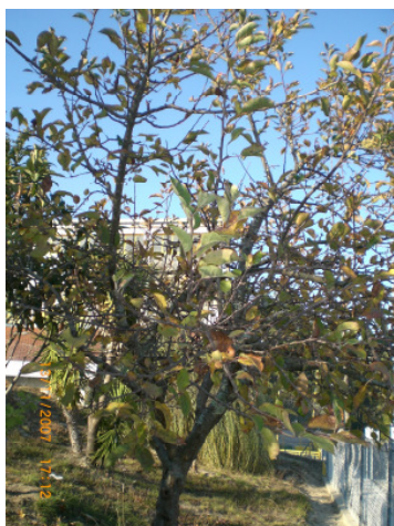
A maceira / a mazá