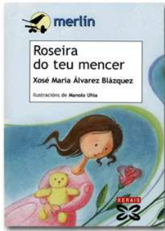
Roseira do teu mencer