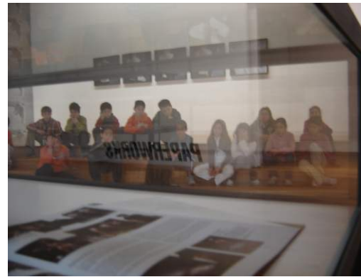
Programa de aproximación ó arte contemporáneo. Actividades no Centro Galego de Arte Contemporáneo.