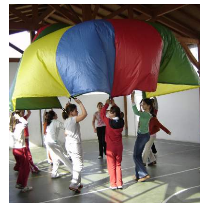
Festa dos xogos