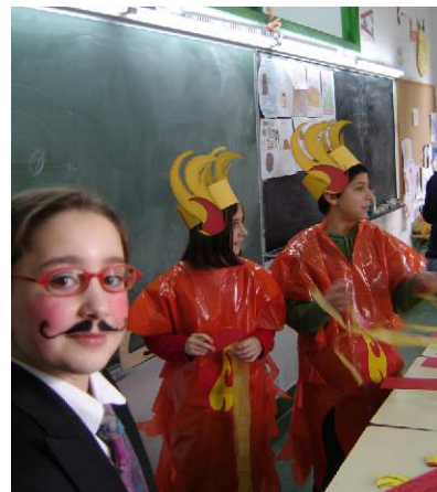
Festa do Entroido