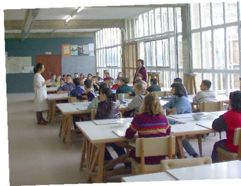
Escola de cerámica (Cerámicas O Castro)