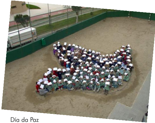
Día da Paz