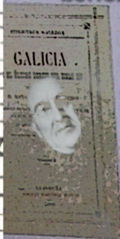
de Galicia en el último tercio del siglo XX, editado por López Ferreiro.