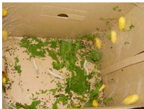
Vermes na cápside