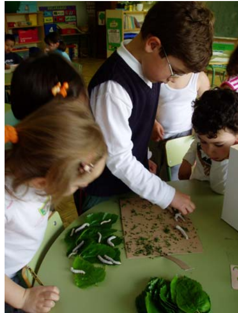
Limparamos a caixa dos vermes