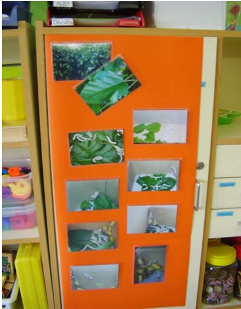
Mural con fotos do seguimento