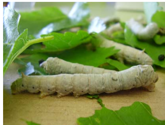
Vermes en crecemento