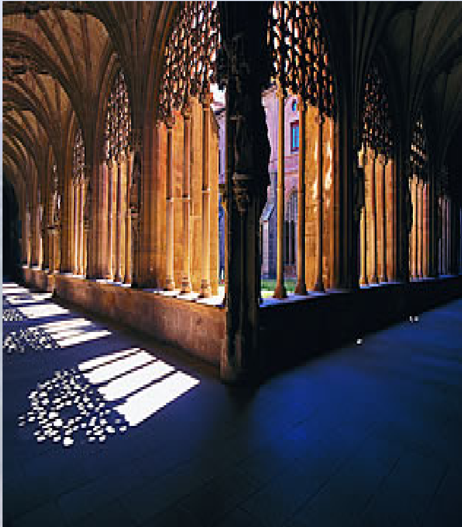
Claustro de los Caballeros de Santa María La Real.