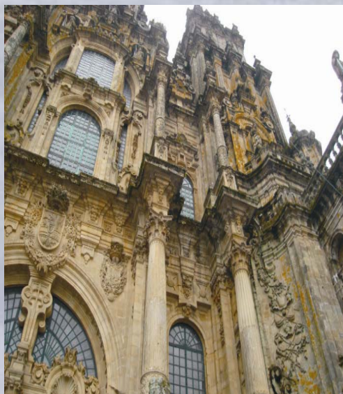
Fachada de la catedral

La catedral es el elemento más representativo de Santiago. Podemos decir que la vía de difusión del arte románico por España fue el Camino de Santiago. Del siglo X al XIII, Las peregrinaciones tienen un gran apogeo. La catedral de Santiago nos muestra el románico en todo o su esplendor. Se empezó a construir en 1075, las obras fueron impulsadas por el obispo Xelmirez. La planta del edificio tiene forma de cruz latina de grandes dimensiones. Lo que más llama la atención son las portadas: la de las Platerías iniciada en por el maestro Esteban, se conserva íntegramente, el Pórtico de la Gloria realizada por el maestro Mateo. .