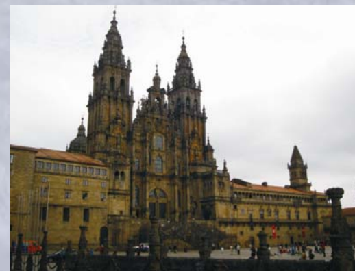
Catedral de Santiago

El Pórtico de la Gloria, es en realidad la fachada románica del templo, constituye una de las más valiosas obras del arte románico universal. En el centro, una columna sostiene el tímpano y la imagen sedente del Patrón de España; en el tímpano aparece Cristo entronizado, rodeado de ángeles enmarcados por 40 ejércitos celestiales; en las arquivoltas, los 24 ancianos del Apocalipsis aparecen tocando instrumentos musicales.