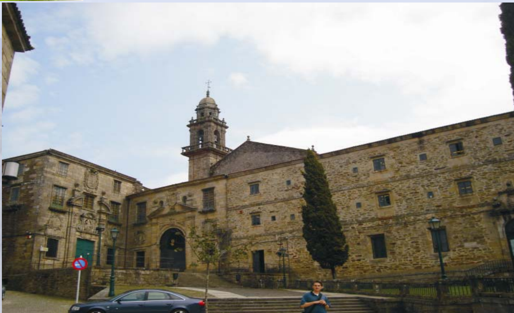
Santo domingo de Bonaval- Museo do Pobo Galego