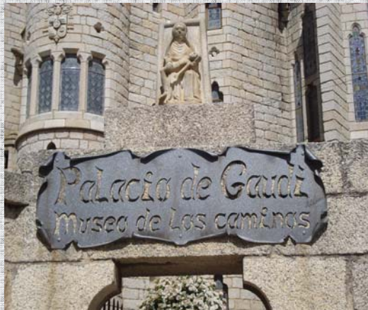
Palacio de Gaudí en Astorga (León).