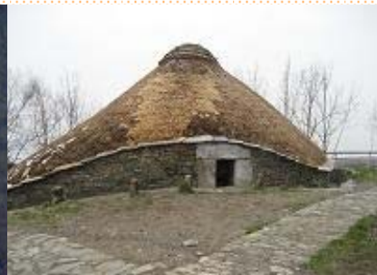
Altar de la Iglesia y palloza de O Cebreiro

Dimos una vuelta por el pueblo, y fuimos a comprar recuerdos a varias tiendas que había por allí. Tenían muchas cosas: bastones, collares, tirachinas y hasta esterillas y sacos