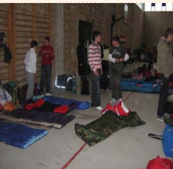
En el pabellón para dormir

Dimos una vuelta por el pueblo, y fuimos a comprar recuerdos a varias tiendas que había por allí. Tenían muchas cosas: bastones, collares, tirachinas y hasta esterillas y sacos