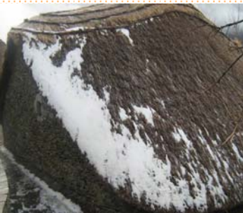
Nieve on O Cebreiro

Después de un largo viaje de dos horas en autobús llegamos al Cebreiro sobre las siete. Al poco de llegar se puso a nevar y hacía mucho frío. Visitamos su iglesia y vimos las pallozas hechas de piedra y paja.