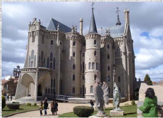
Vista completa del Palacio.