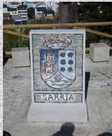
Monasterio de Samos (Lugo).