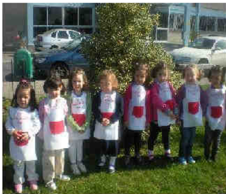
VISITA A ESCOLA DE HOSTELERIA DE VILAMARIN