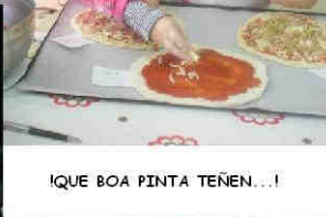
¡QUE BOA PINTA TEÑEN...!