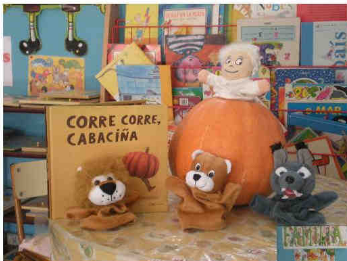
Os nenos de Infantil