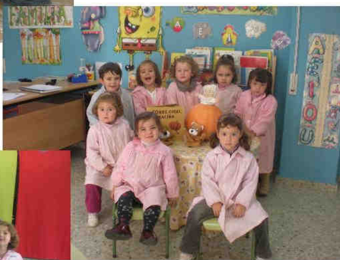
preparan o conto