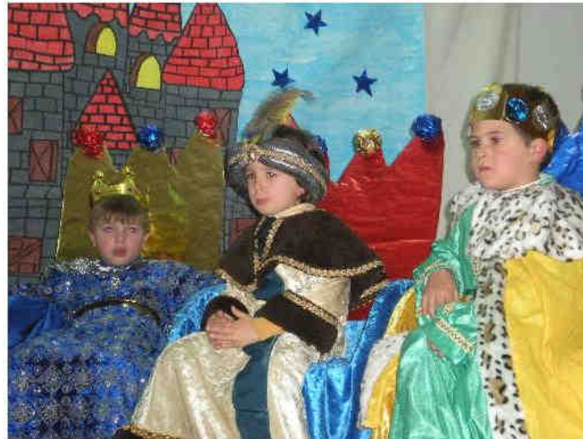
"A CARTA OS REIS MAGOS"

Os nenos de Infantil fixeron unha obra de teatro moi fermosa