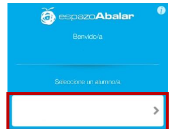
Paso 5, selección do alumno