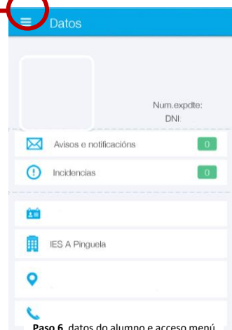
Paso 6, datos do alumno e acceso menú

No tocante das faltas, hai dúas cores que indicarán o estado das faltas. Se a falta está en cor vermella, correspóndese a unha falta sen xustificar, en caso de ser de cor verde, trátase dunha falta xustificada e aceptada a xustificación polo titor.