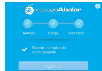
Paso 4, confirmación rexistro