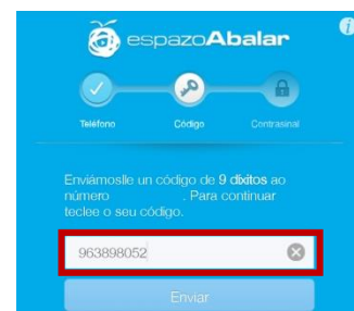
Paso 2, inserimos código