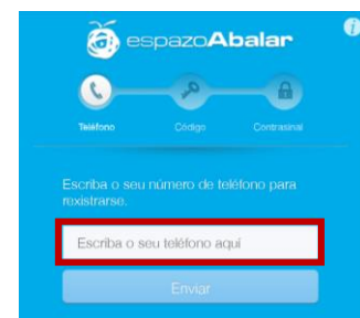
Paso 1, identificación do número