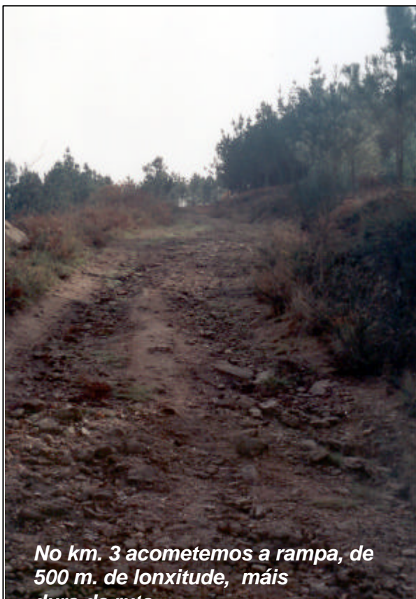
No km. 3 acometemos a rampa, de 500 m. de lonxitude, máis

A “Pedra dos Ballotes” atópase dentro dun valado e representa cervos de grande tamaño e deseño esquemático. Destacan tres grandes figuras gravadas na parede inclinada ó noroeste, que camiñan, máis ou menos en liña, en