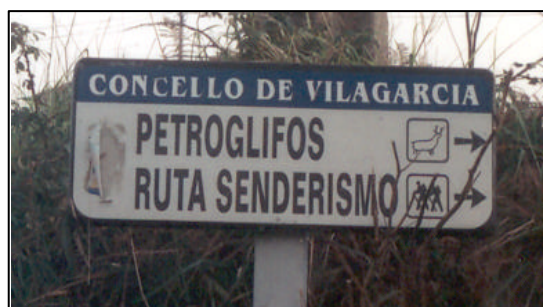
A ruta iníciase en Bamio xunto ós petroglifos de “Os Ballotes”

Saíndo de Vilagarcía pola estrada en dirección a Santiago de Compostela unha vez pasado o pobo de Carril, e superado tamén un concesionario de automóviles, collemos un cruce á man dereita (estrada a Bamio) onde, a uns 200 metros, temos de novo un desvío á dereita que nos leva ós petroglifos da “Pedra dos Ballotes” (km 0 da ruta).