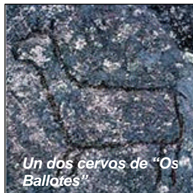
Un dos cervos de “Os Ballotes”

dirección norte - sur. Os petroglifos de Os Ballotes, representación es de arte