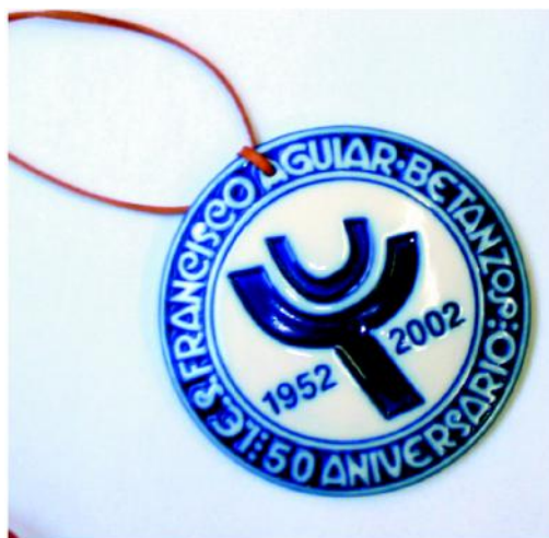
Medalla conmemorativa do 50 Aniversario da creación do Instituto «Francisco Aguiar». Nela aparece o logotipo do Centro, deseñado polo pintor Alfonso Sanjurjo.

Tal como sucedera co Instituto da época da República, o Instituto Laboral estivo tamén instalado inicialmente, de xeito provisional, no antigo convento de Santo Domingo. Non obstante, o Ministerio aprobou en 1953 a construción dun edificio para o Instituto.