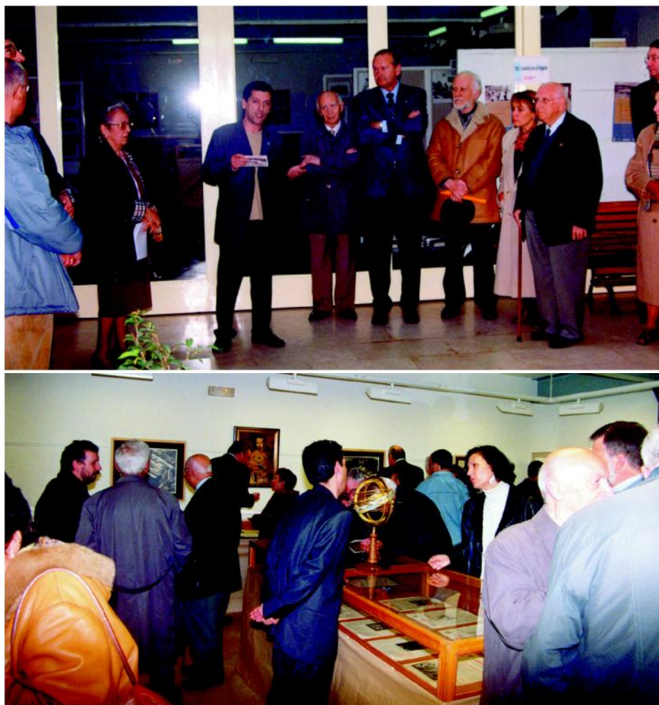
Acto de inauguración da Mostra Fotográfica e Documental «O Instituto Francisco Aguiar. 50 anos de educación en Betanzos».