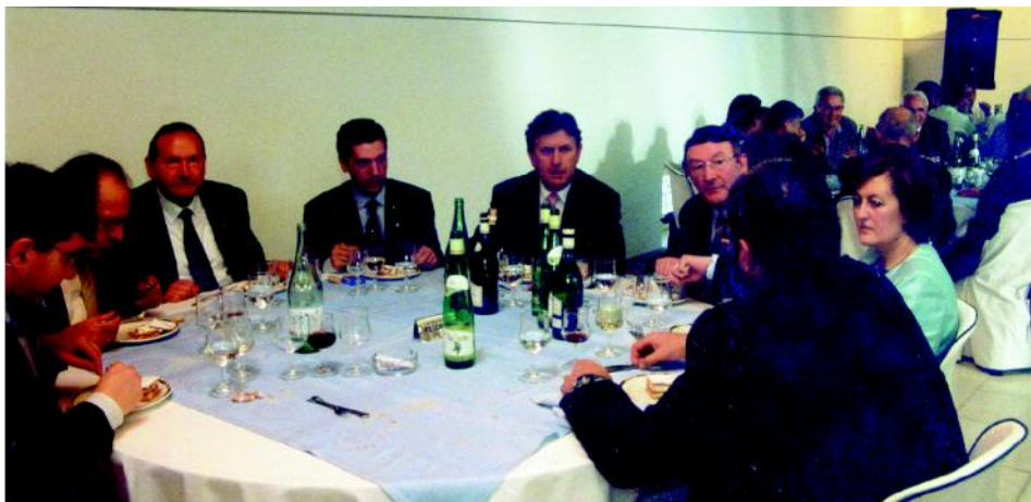
Comida conmemorativa do Cincuentenario do Instituto «Francisco Aguiar» de Betanzos.