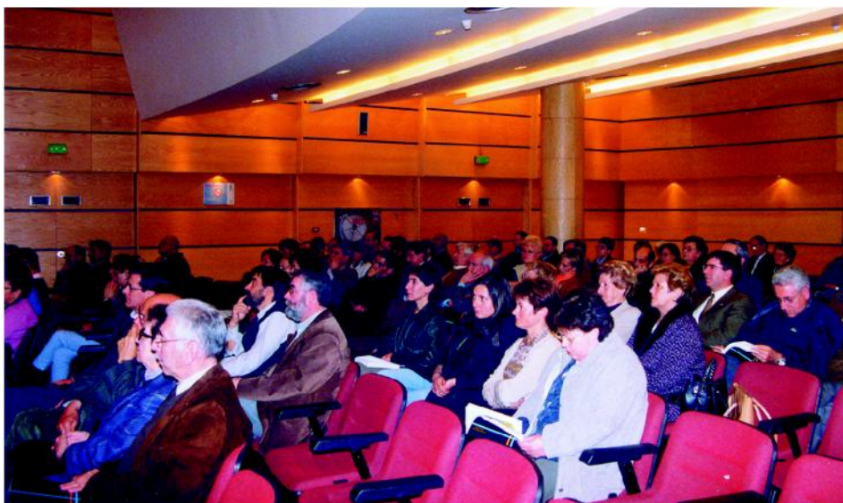
Aspecto da Aula Municipal de Cultura na presentación do libro conmemorativo do Cincuentenario do Instituto «Francisco Aguiar».

todos aportan su grano de arena y, para mí, cuando lo hace el Alcalde con su artículo, tiene el valor de hacerlo como un antiguo alumno más, que une su voz a ese coro de muchachos que aquí, con entera libertad, encauzaron sus inquietudes y sus estudios.