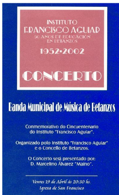
Cartel anunciador do Concerto conmemorativo do Cincuentenario do Instituto «Francisco Aguiar».