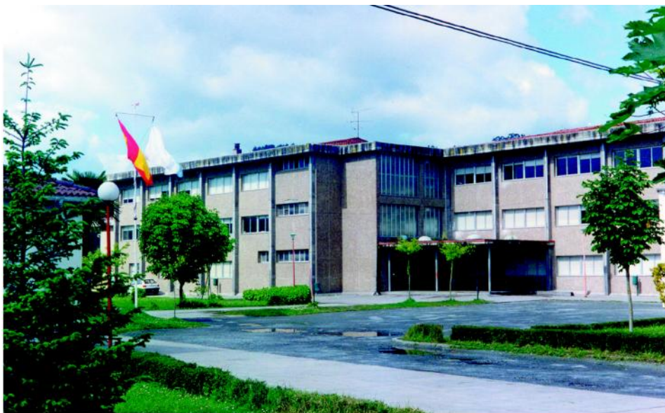
Edificio actual do Instituto «Francisco Aguiar»

Así mesmo, o Instituto “Francisco Aguiar” publicaba cada ano un volume no que aparecían os traballos premiados na edición anterior. Precisamente ó prólogo dun deses libros, o publicado en 1993, corresponden as seguintes palabras que o profesor e membro da Real Academia Galega Xesús Alonso Montero dedica ó Instituto de Betanzos e ó labor que nel se vén realizando: “¿Que se pode facer na aula, desde unha modesta cátedra ou silla, nun tecido moral e intelectual tan pouco sensible á palabra do profesor que imparte leccións de Ciencia, de Humanidade ou de Civilidade? Pese a todo, hai compañeiros que