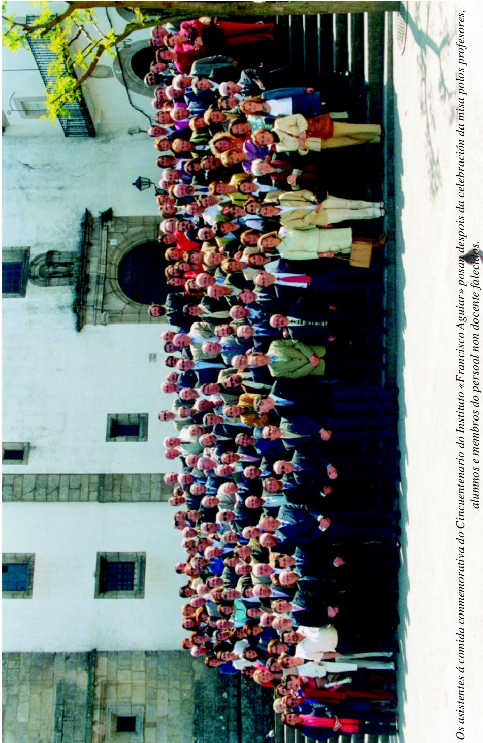
Os asistentes á comida conmemorativa do Cincuentenario do Instituto «Francisco Aguiar» posan despois da celebración da misa polos profesores, alumnos e membros do persoal non docente falecidos.