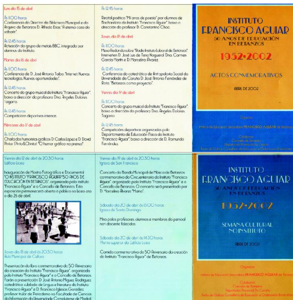
Programa dos actos conmemorativos do Cincuentenario do Instituto «Francisco Aguiar»

Para celebrar o seu cincuentenario, o Instituto “Francisco Aguiar” organizou un programa de actos que se desenvolveron durante o mes de abril de 2002 e nos que o