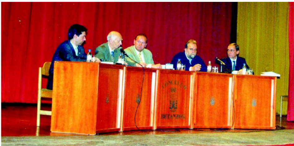
Acto de presentación do libro do Cincuentenario do Instituto «Francisco Aguiar».