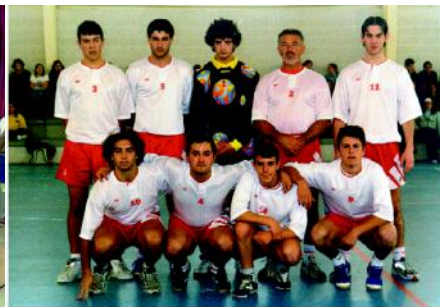
Un dos equipos de balomán participantes no Torneo do Cincuentenario do Instituto.