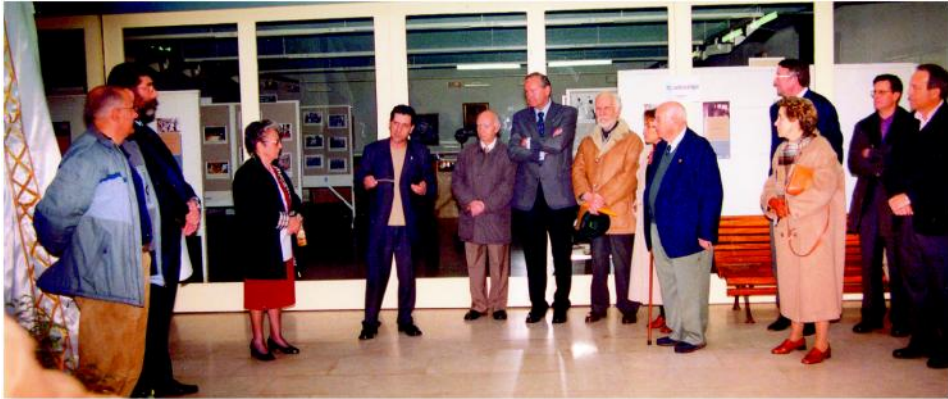
Inauguración da Mostra «O Instituto Francisco Aguiar. 50 anos de educación en Betanzos».