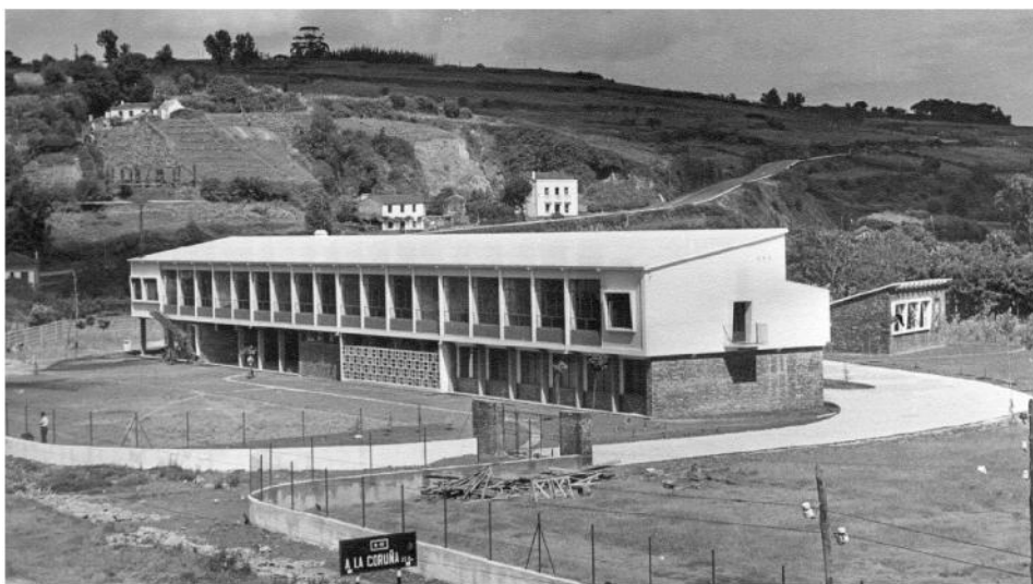
Antigo edificio do Instituto «Francisco Aguiar»