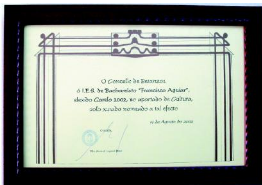
Diploma do premio Garelo 2002, outorgado polo Concello de Betanzos ó Instituto «Francisco Aguiar».

Entre os factores que contribuíron tamén nos últimos anos a proxectar a imaxe do Instituto “Francisco Aguiar” cabe resaltar o feito de terse convertido nun dos centros que