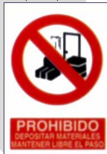
Prohibido depositar materiais. Manter libre o paso