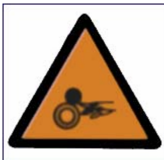
Perigo de atrapamento

Ademais dos sinais vistos anteriormente, hai outras circunstancias ou máquinas que precisan indicacións particulares de risco e que poden estar sinalizadas con pegatinas como as que segue: