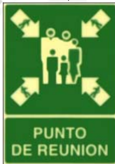
Punto de reunión