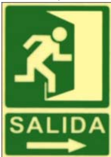
Saída á dereita