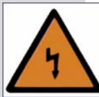
Uso obrigatorio de gafas