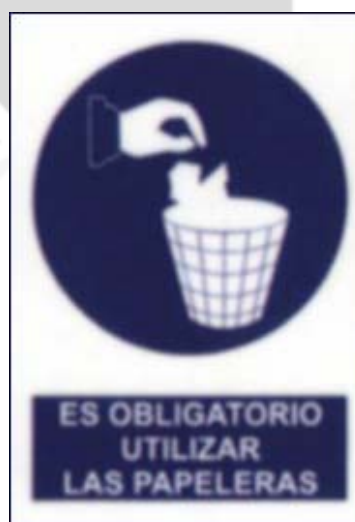
Obriga de utiliza-las papeleiras