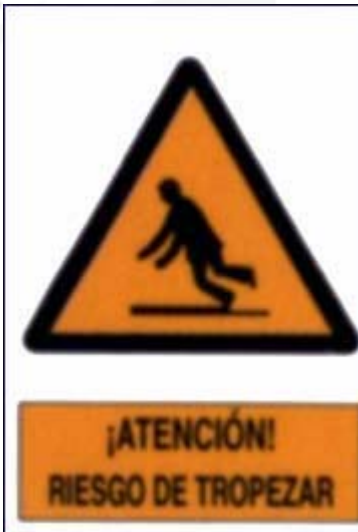
Risco de tropezar