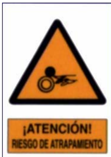
Perigo de atrapamento