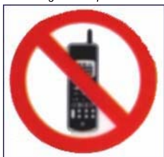
Prohibido utilizar móbil