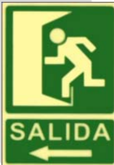
Saída á esquerda