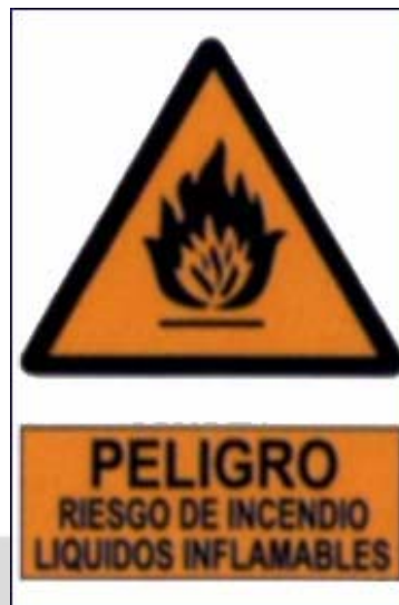
Perigo: risco de incendio. Líquidos inflamables