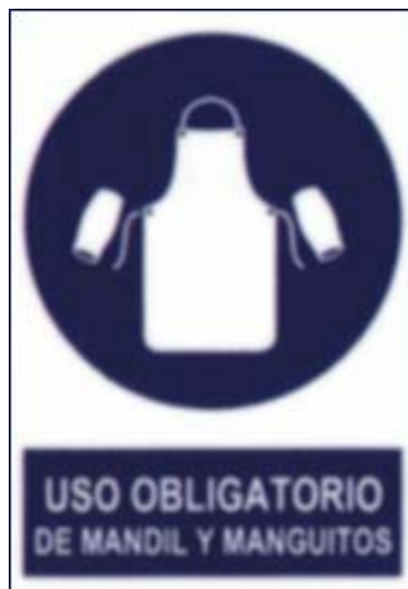
Uso obrigatorio de mandil