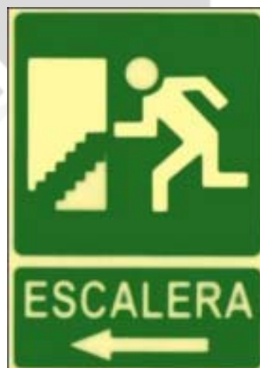
Escaleira á esquerda