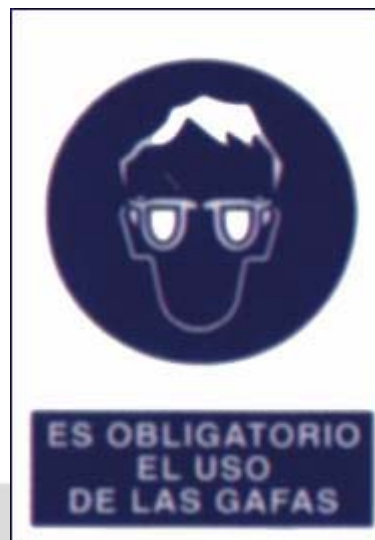
Uso obrigatorio de gafas