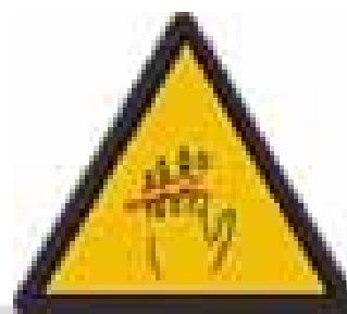
Perigo de amputación