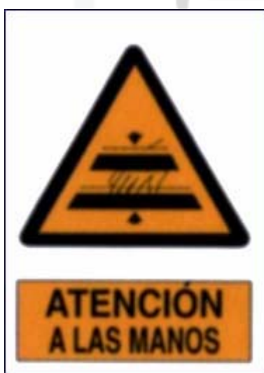
Atención ás mans