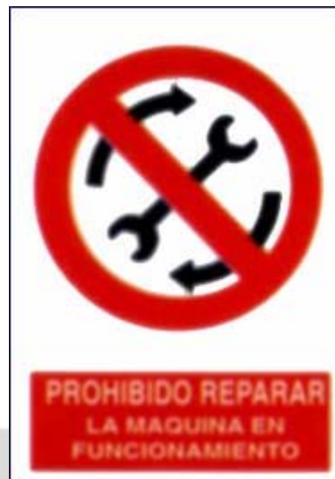
Prohibido repara-la máquina en funcionamiento