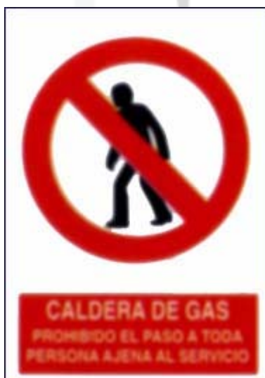
Caldeira de gas. Prohibido o paso a toda persoa alléa ao servizo