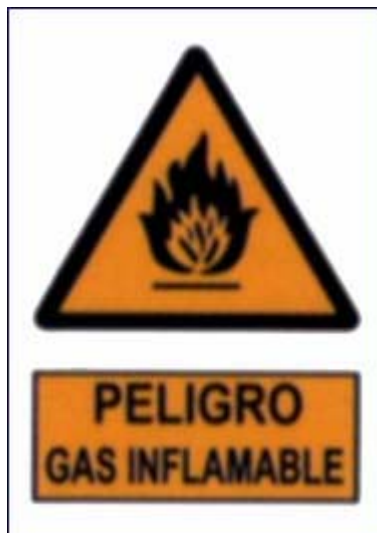
Perigo: gas inflamable