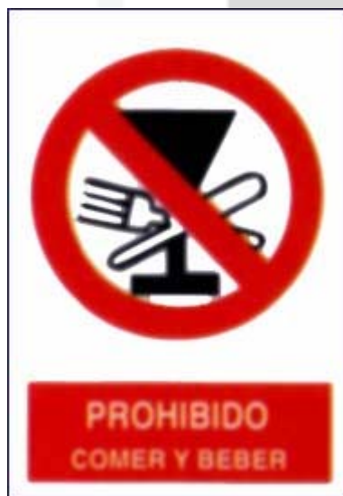
Prohibido comer e beber