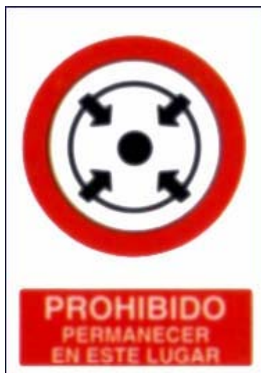
Prohibido permanecer neste lugar