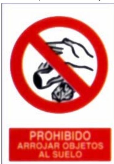
Prohibido arroxar obxectos ao chan