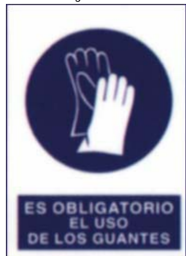
Uso obrigatorio de luvas