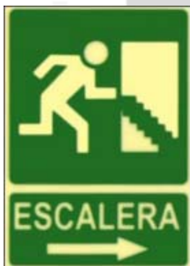
Escaleira á dereita