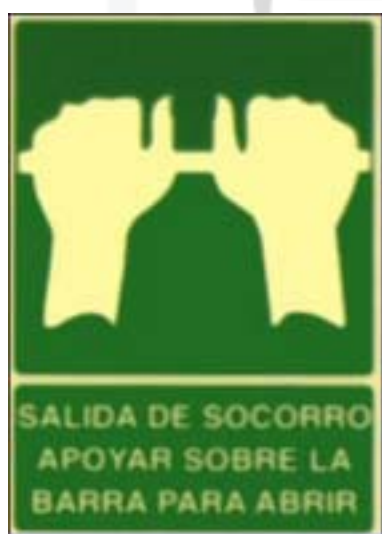
Saída de socorro. Apoiar sobre a barra para saír