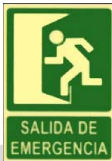
Saída de emerxencia