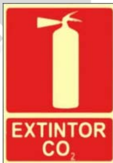
Extintor de CO 2