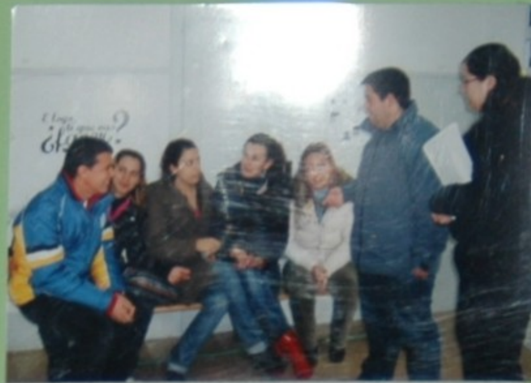
-Hai un concurso. Apuntámonos? -Sí -Veña, vale. -O que oh? Eu non! Négame!