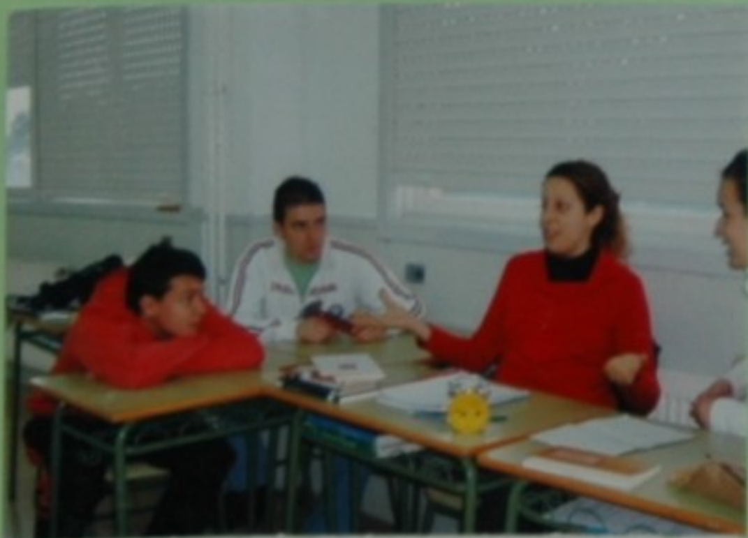
-A historia xa está; a que inventáramos o ano pasado.