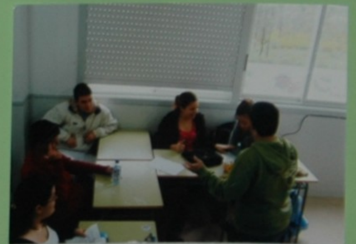
-Hai que complicala. Ten que haber mortes, enfermidades raras coma o cancro de sida descuberto por min, drogas, sexo... de todo un pouco! -Que inmoralidade!