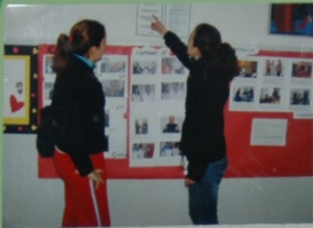
-Mira! Un concurso dunha fotonovela. Comentámosllelo ó resto? -Sí. Que boa ideal