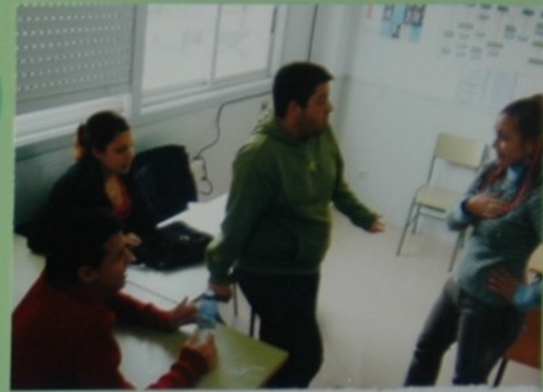
-Pero cal vai ser o argumento? -Ten que ser unha historia romántica... -Boh! Iso son chorradas! -Tes o corazón de pedral