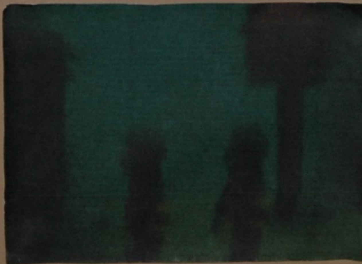
E esa mesma noite, apareceron na granxa dúas sombras moi estrañas