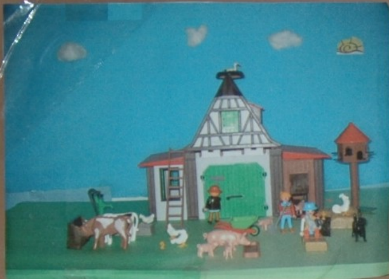
Paixón de gaivotas

Nunha granxa dun lugar moi, moi preto de aquí algo ben estraño esta apunto de ocorrer.