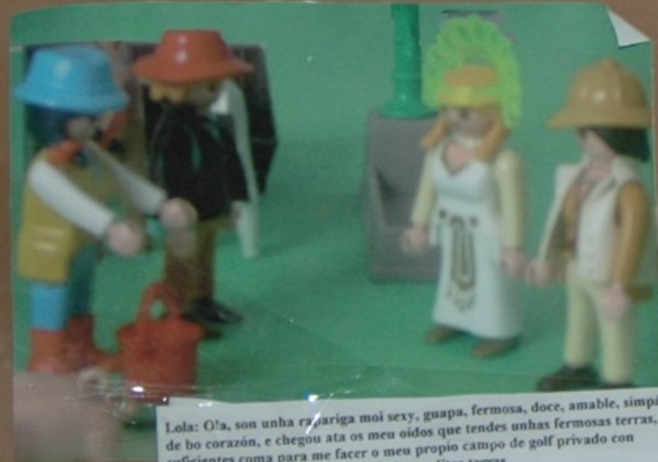
Lola: O!a, son unha rapariga moi sexy, guapa, fermosa, doce, amable, simpática e de bo corazón, e chegou ata os meu oídos que tendes unhas fermosas terras, as suficientes coma para me facer o meu propio campo de golf privado con aparcadoiro, e viña a fixar un prezo por ditas terras.

Maruxa: Sentimosllo pero o noso lar non esta en venda.