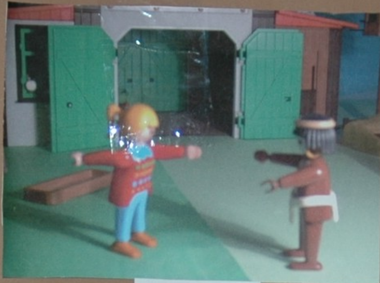
Louriña: e eu serei a primeira. King: e eu tamén.