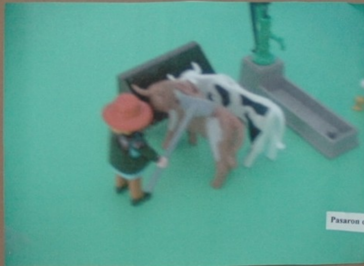
Pasaron días e días, ata que...

Rosa M a da Concepción de tódolos santos e virxes: Si? Pois eu xa me vou andando.