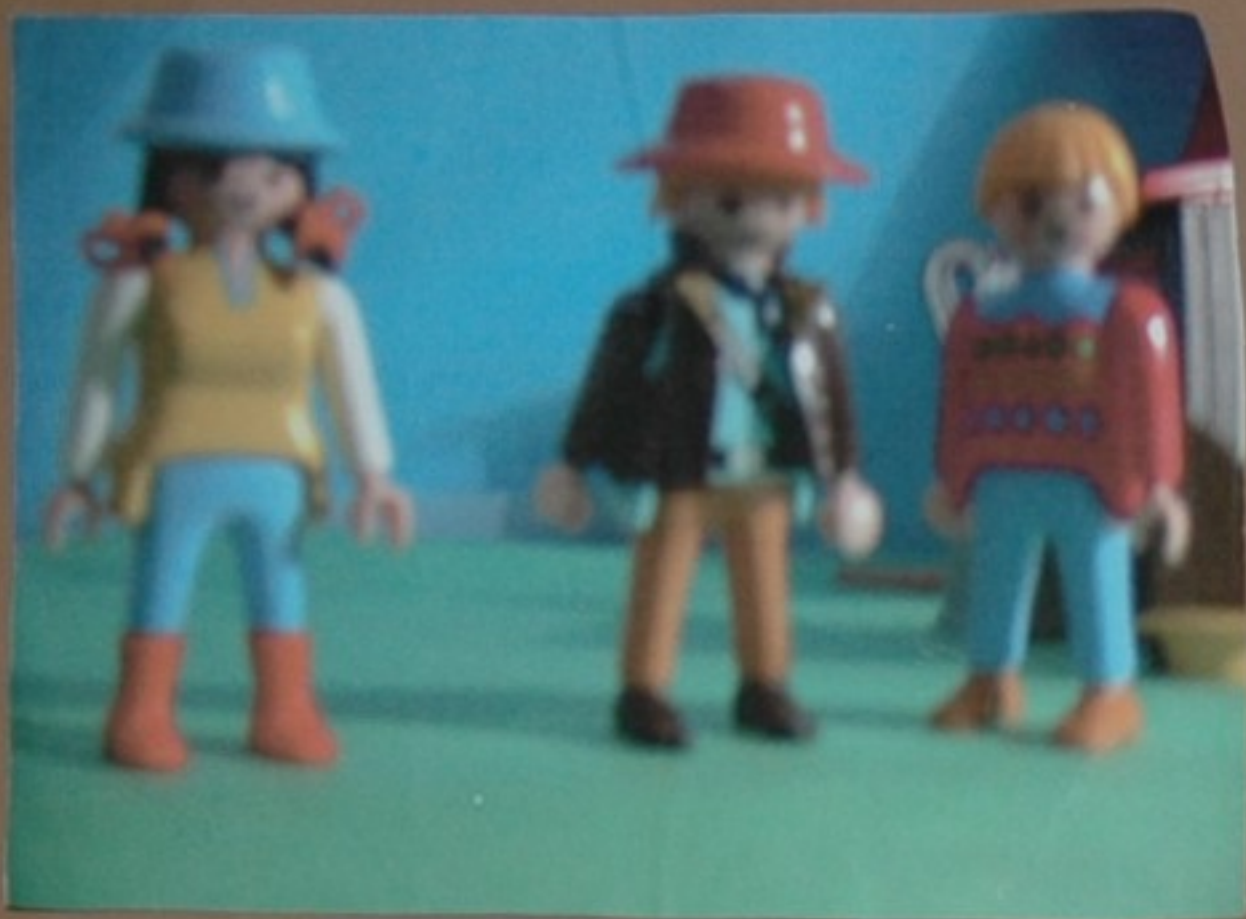
Maruxa: Se queredes as nosas terras teredes que loitar por elas.