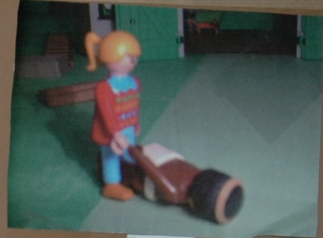
Louriña: Huá. King: aaaaaaarg...