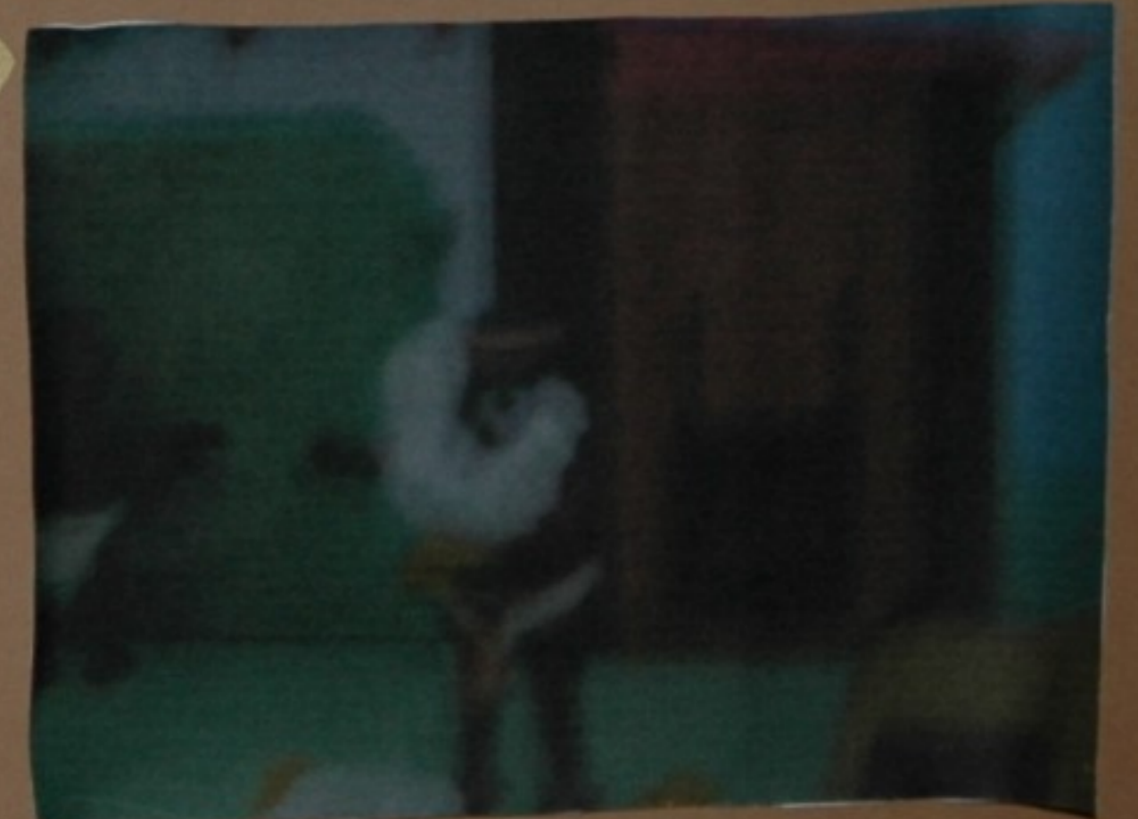
King: Carafio brother, estas galiñas están que te caguing for you, eu lévome unha para a casa despois de ensinarllas a xefa, que boa captura my friend.