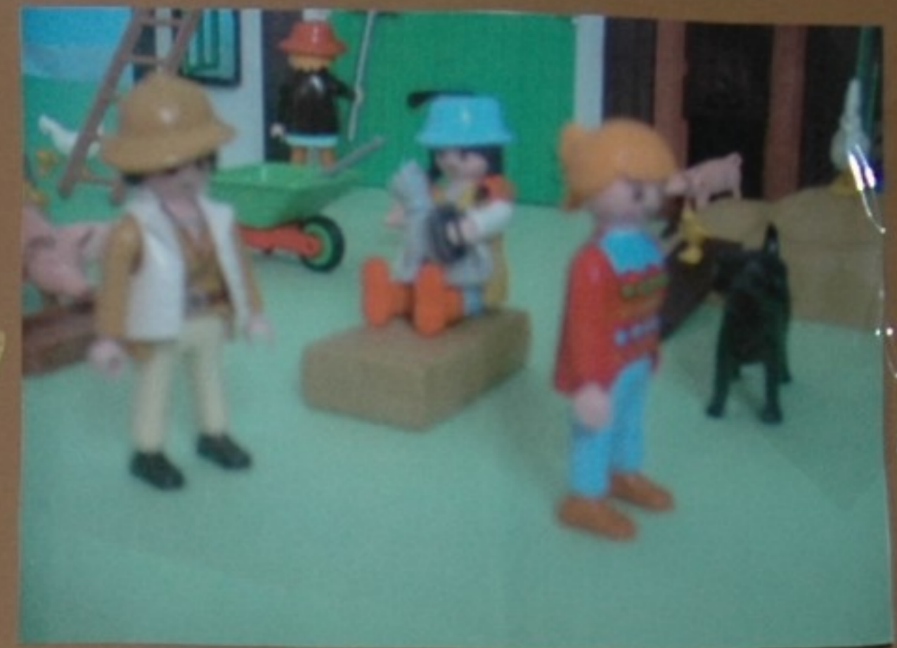
Rosa M a da Concepción de tódolos santos e virxes: Bos días meu super-coche se me estropeou detrás da vosa granxa, osea, supergranxa. E quería saber se tendes por aquí un supermovil de ultima xeración, con pantalla liquida, bluetooth, infravermellos ... vamos osea un móbil decente de flipar.

Louriña: Nos non pero seguro que Pancha ten un na casa. Vamosllo pedir (como siga así non me vai dar tempo a deitarme baixo o pombal).