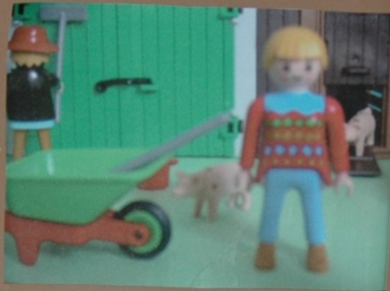
Louriña: Que cansa estou! voume deitar un rato a sombra do pombal.

Nunha granxa dun lugar moi, moi preto de aquí algo ben estraño esta apunto de ocorrer.