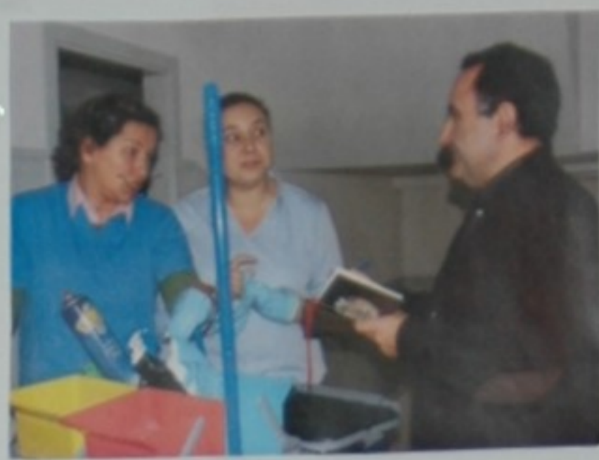
- Ai, sí! Ben me acordos! - Son moitos anos vendo moitas cousas!