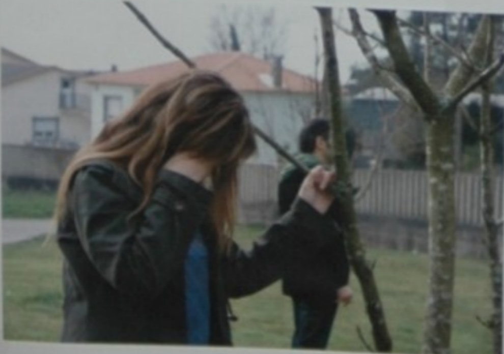
- Nunca te olvidarei! - Nunca perdoarei!