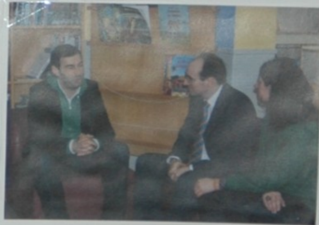
- É o mellor para ti! É das mellores familias de todo o Val de Barbançeira!