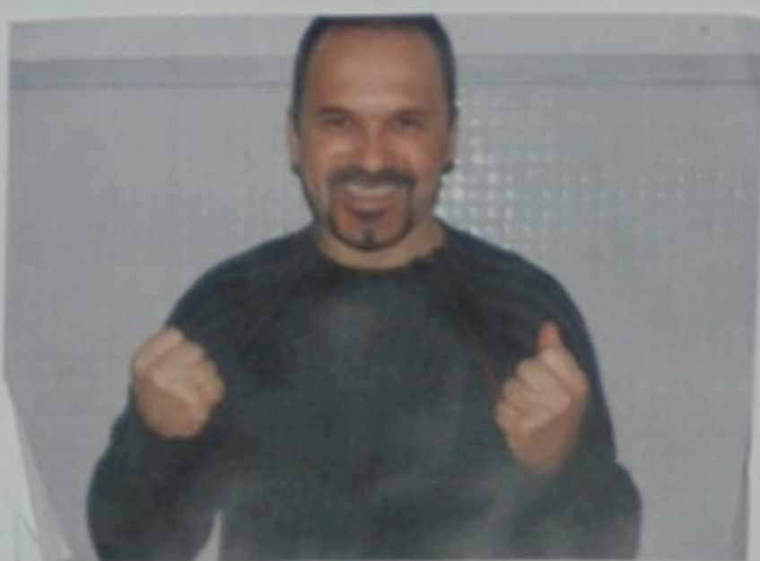
"Xa te teño! A unión con ese paifoco dos Andrade é imposible."