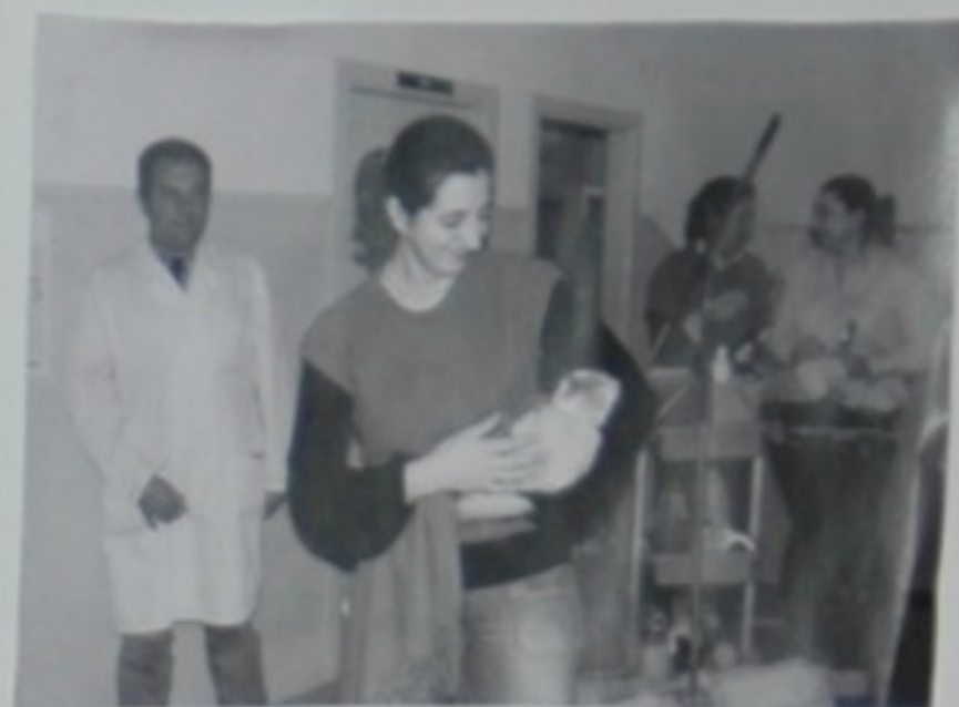
- Oh, ver e calar!