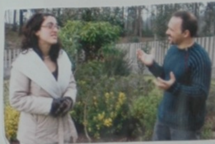
"Como é posible! Tanto tempo esperando a que esa tal Mariña desaparecese da escena e agora resulta que por unha contrariedade sen importancia non vou casar con Eduardo Salvador. De ningunha maneira! Por este ningún sabera nada!"