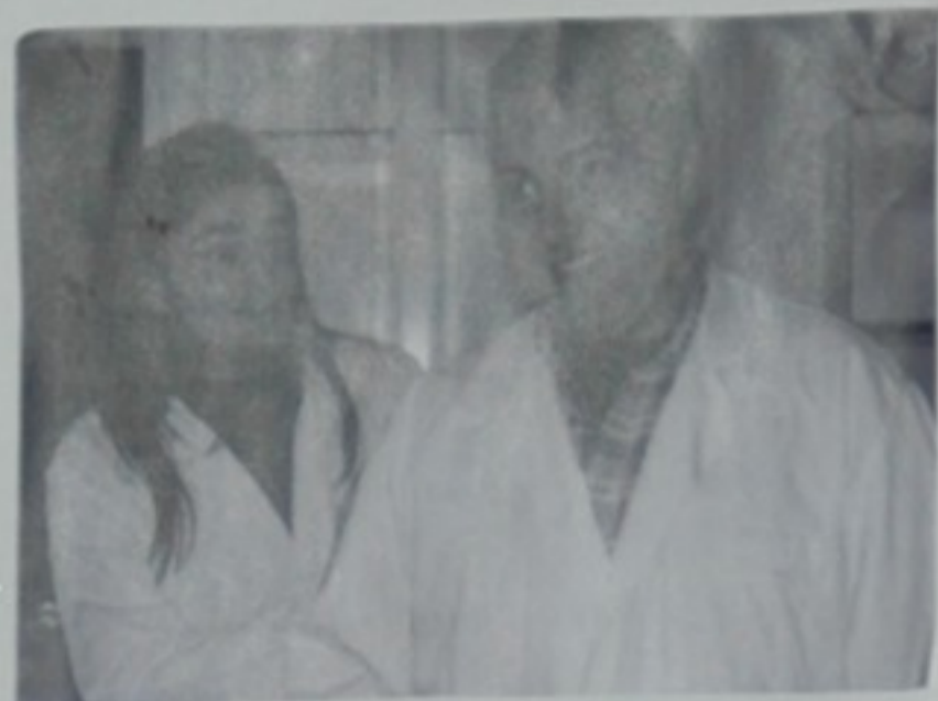
- Pero teame a min! Debes vivir o presente! - Só poderei vivir o presente cando acabe co pasado! - Que dirán! Vaise dar conta, non ves a marca na orella!

- Adelaida rexeitome! Preferiu un Varela Andrade e agora vai criar o fillo doutrol