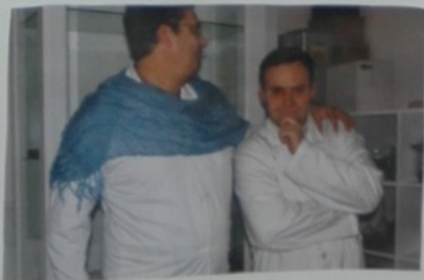
- Churri, e logo que tramará Barbarela agora? - Nada bo, seguro. Non a imaxino eu ocupándose dos problemas cos ratos.