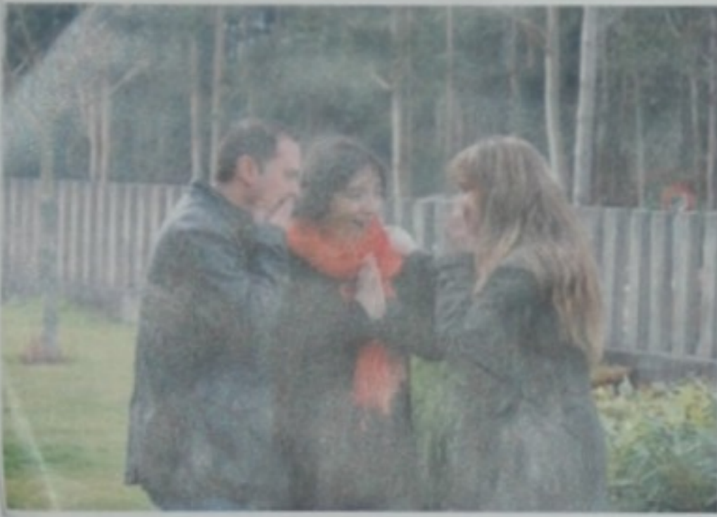
- Xa veredes... É tan guapo! Vaivos encantar!