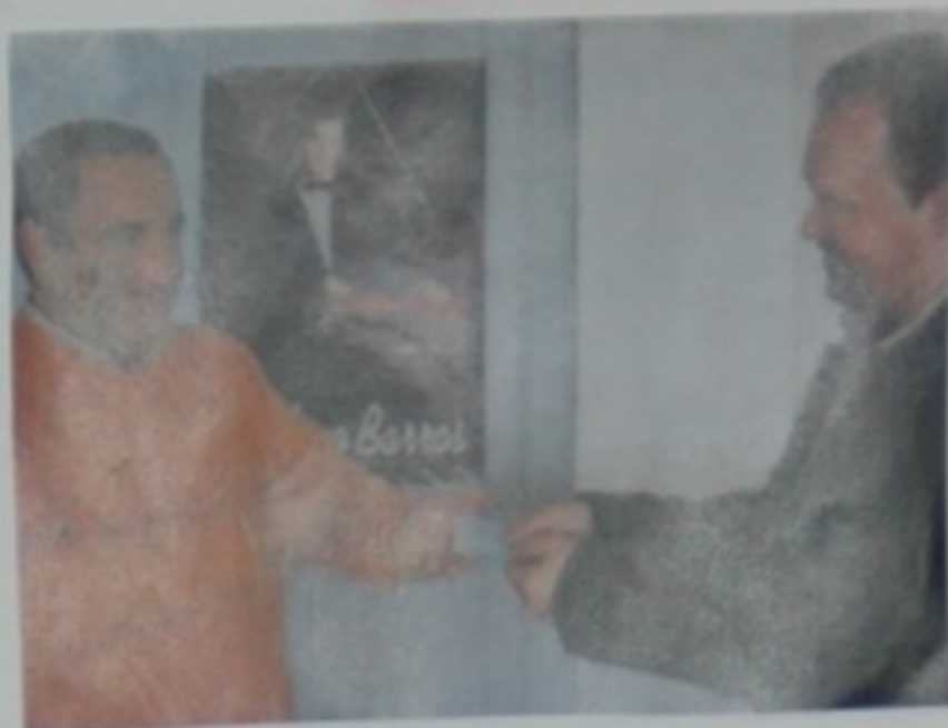
¡Moi ben, iso déixao nas miñas mans! Se de algo teño sona é de atopar sempre cousas turbias, mesmo nas familias máis honradas, e os Varela Andrade non van ser menos.

"Por riba do meu cadáver; non pararei ata que sexas miña, irmá querida!"