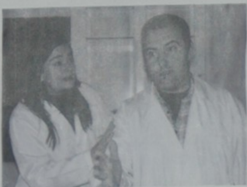
Ti teleachez! Non debes facer iso!

- Adelaida rexeitome! Preferiu un Varela Andrade e agora vai criar o fillo doutrol