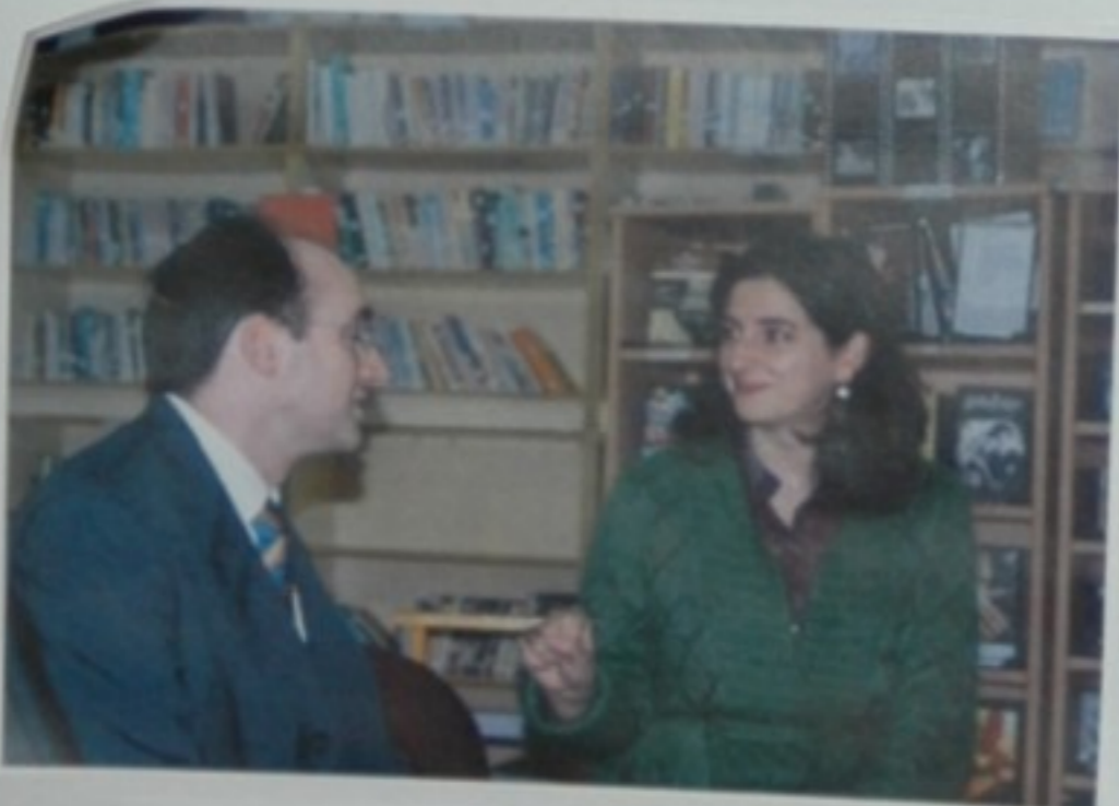
- Isto hai que amañalo! - Estás pensando o mesmo ca min? - A nena dos Soutolongo...!