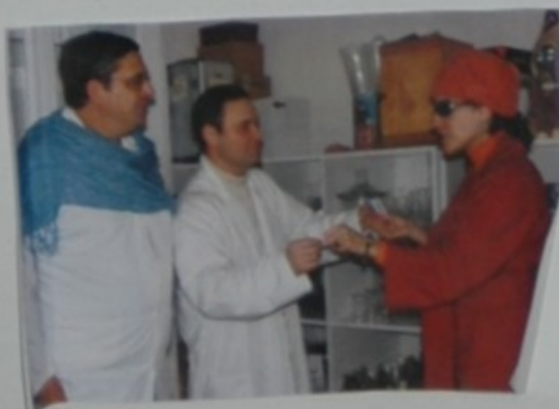
- Seguro que isto será suficiente?