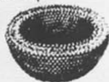
Corte transversal del liposoma

liposoma restaura la fluidez de la membrana por fusión biológica y despierta las células asfixiadas. Estimuladas por el liposoma, las células vuelven al trabajo. RESULTADOS ESPECTACULARES. Desde las primeras aplicaciones, vuestra tez se aclara, vuestro rostro se ilumina. Dos semanas después, la profundidad de las arrugas ha disminuido en un 50%. Al mes, vuestra piel ha recuperado su tonicidad y el óvalo del rostro ha ganado en firmeza.