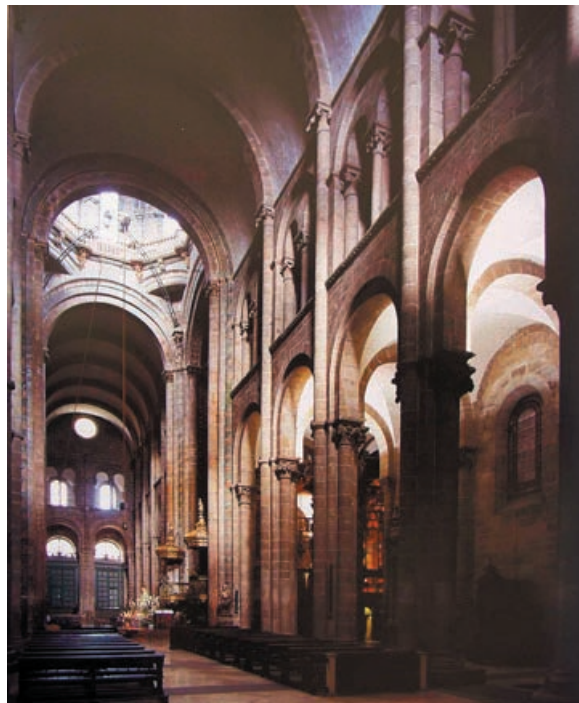
Lámina 2 (hasta 4 puntos). / Lámina 2 (ata 4 puntos).

Señala sus características formales (hasta 1 punto). / Sinala as suas características formais (ata 1 punto).