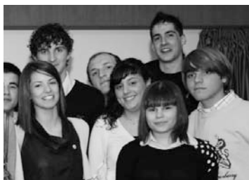
Acto de despedida do alumnado de 2º de Bacharelato (2008)