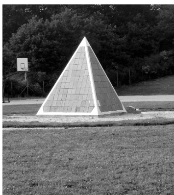
Monumento a Manuel Colmeiro