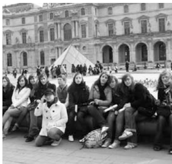
Excursión a París (2008)