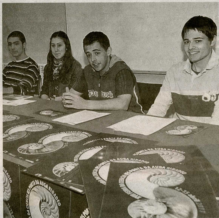
Alumnos del IES Porta da Auga, ayer en la presentación. MIGUEL