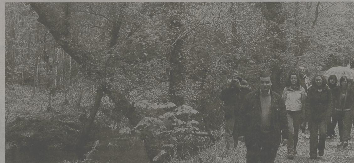
Un grupo de senderistas caminan por la orilla del río Ouro, en la parroquia de Fazouro. XAIME F. RAMALLAL