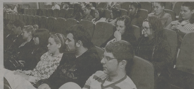
La Semana da Saúde ofreció ayer una mesa informativa.