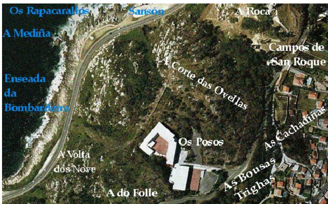
Microtoponímia da zona do instituto "Primeiro de Marzo", Baiona.

Os mariñeiros de Baiona, incluídos os da Percibilleira, téñenlle nomes ós lugares do mar. O edificio do instituto domina dende o alto a costa entre O Sansón e a Enseada da Bombardeira: Sansón entre os baixíos de Tres Pasos e Rapacarallos, xusto por baixo do Instituto: A Lagariza, A Mediña, As Salgueiras e indo cara á beiramar de Baredo a pedra mais sonada desta parte da costa: A Bombardeira.