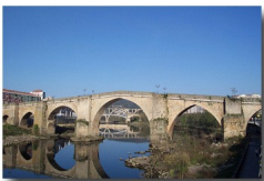
Ponte romana Fotos dispoñibles no portal educativo

No DOG nº 4 do luns 7 de xaneiro sae publicada a Orde do 21 de decembro de 2007 pola que se regula a avaliación