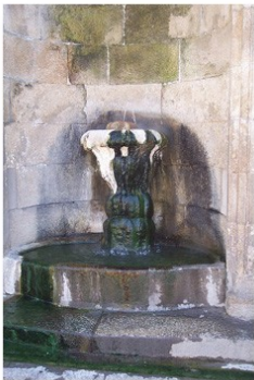
Fonte das Burgas