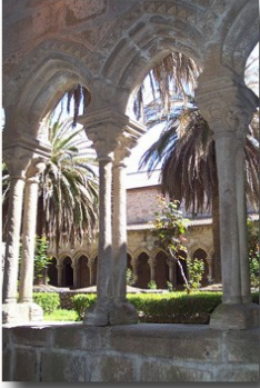
Claustro de San Francisco