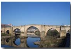
Ponte romana Fotos dispoñibles no portal de contidos educativos