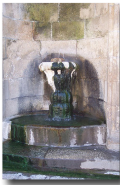
Fonte das Burgas