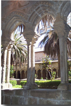
Claustro de San Francisco