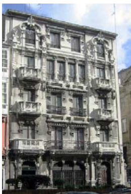
Rúa Juana de Vega