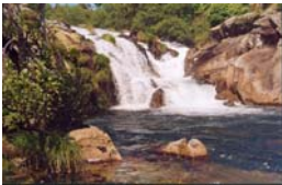
Caldas do inferno. Corcubión (A Coruña)