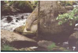
Río Arenteiro, curiosa cara no río (Pontevedra)