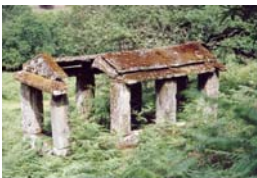
Restos dun Canastro no Camiño Real. A Laxe (Pontevedra)