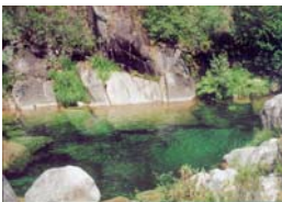
Poza da Fecha (Ourense)