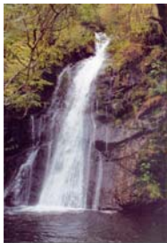
Fervenza de Vieiros (Lugo)