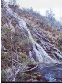
Fervenza de augas Caídas (A Coruña)