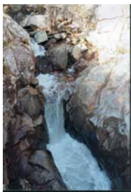
Fervenza do Pozo dos Fumes (Ourense)