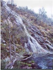
Ferrenza de augas Cálidas (A Coruña)