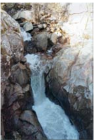
Ferrenza do Pozo dos Fumes (Ourense)