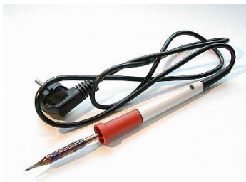
Fotografías dispoñibles nas galerías fotográficas do Portal de Contidos, de libre disposición para uso educativo.