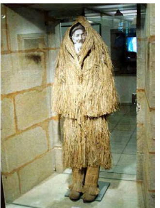
Fotografías dispoñibles nas galerías fotográficas do Portal de Contidos, de libre disposición para uso educativo.

A Unidade de Muller e Ciencia saca á luz a revista Xenia . Esta publicación, dirixida ao