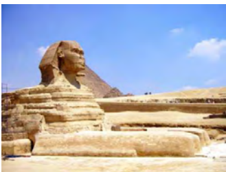
Fotografías dispoñibles nas galerías fotográficas do Portal de Contidos, de libre disposición para uso educativo.